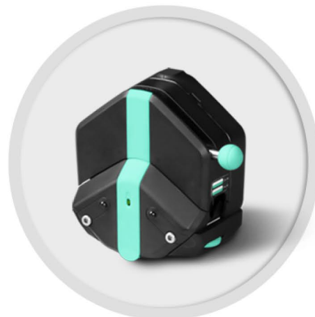
EasyPump-PPS 系列 (不可调压)