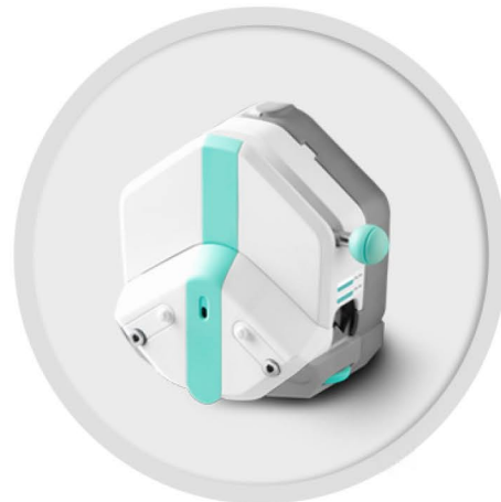
EasyPump 系列 (不可调压)